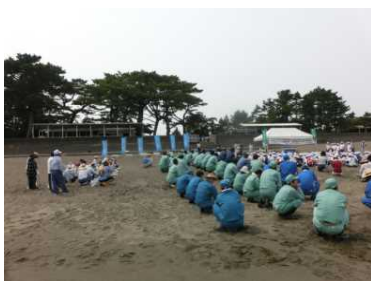
近隣の企業や地域の方も参加