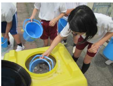
家庭との連携で集めた米のとぎ汁