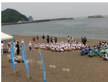
見能林小学校からは5・6年生が参加