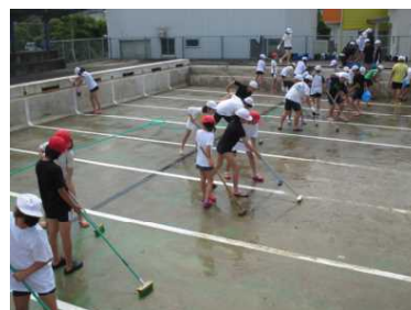
4～6年生で EM 菌を利用したプール清掃