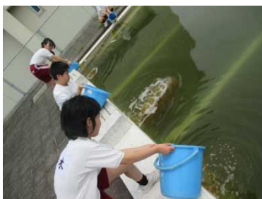
みんなで EM 菌をプールに流す