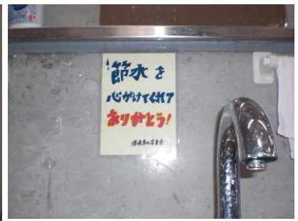
「節水を心がけてくれてありがとう」