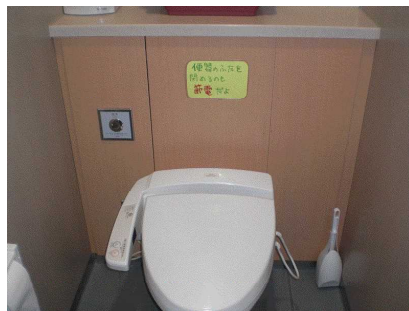
「便器のふたを閉めるのも節電だよ」