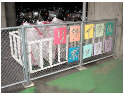
・体育館下に設置された「リサイクルボックス」

「リサイクルボックス」設置場所には、「新聞紙・ダンボール等の紙類」と「ペットボトル・缶」の2種類のボックスがあり、生徒・保護者・地域住民がいつ来ても資源ゴミを回収できるようにしている。