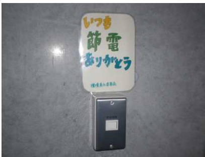
「いつも節電ありがとう」