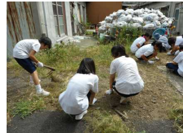
「ジュニアボランティア 寺子屋(第1学年)」