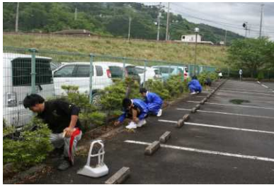
「町内ボランティア(全校)」