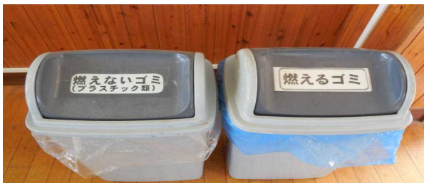
ゴミ箱に分別シールを貼付