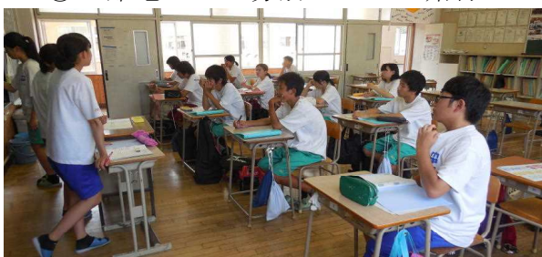
生徒会整美委員会で掲示に関する役割分担