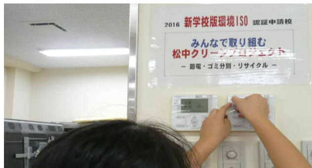
環境 ISO コーナー (上) 節電の呼びかけ (下)