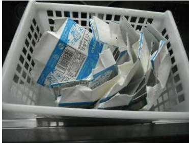
給食の牛乳パック