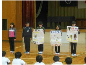
全校集会にてお知らせ