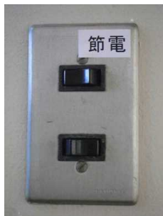
節電・節水シール