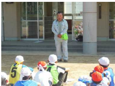
町の水と環境を守る会