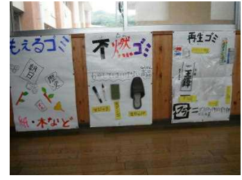
実物分別ポスター