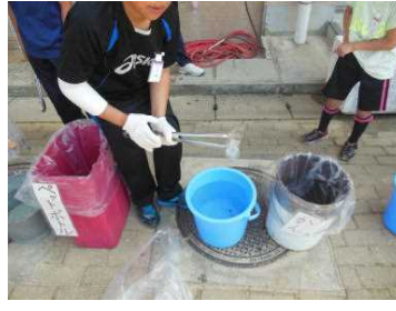
拾った物はあらって