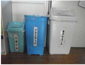
教室の分別ゴミ箱設置