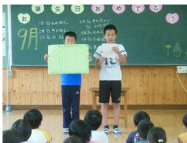
児童集会での呼びかけ