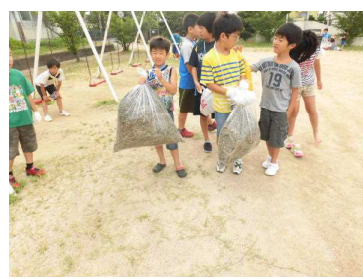
夏休み期間での，地域子ども会ごとの清掃活動