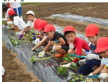
作物が元気に育つ環境づくり「さつまいもの栽培」