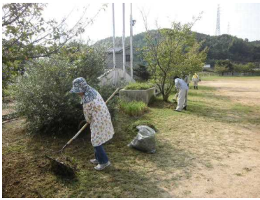
地域ボランティアによる 草刈りや樹木の剪定