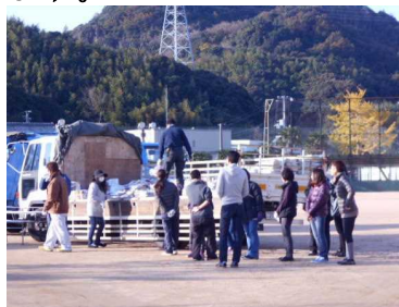
P T A 活動としてリサイク ル品回収を行う