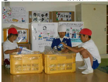
3年児童が中心になり, アルミ缶等を回収する