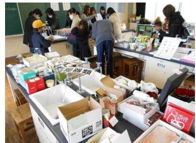
各家庭から集められたリ サイクル品でのバザー