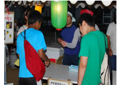
子ども夏祭りでの, ごみ 分別の呼びかけ