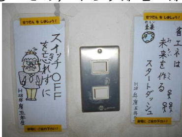
スイッチに節電（標語入り）ステッカーを貼る（5年）