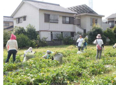
P T A 奉仕作業での草刈り や用水路の清掃