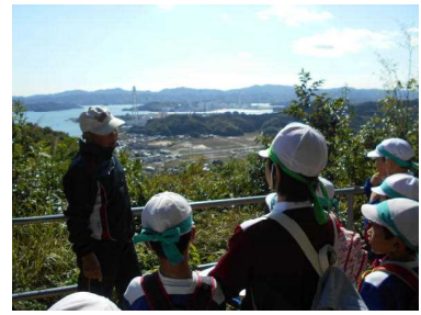
地域のよさを再発見する オリエンテーリング