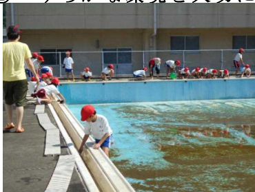
EM活性液を利用したのプール清掃