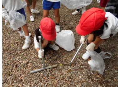
自然観察後の清掃活動 (1・2年)