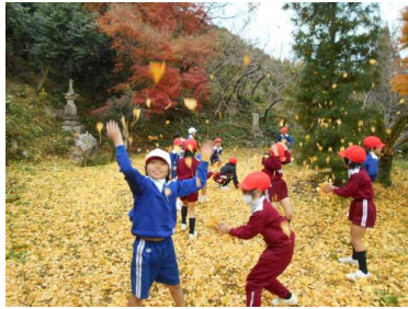
地域の自然のよさを知る (1・2年)