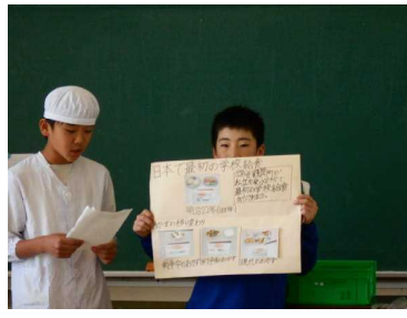
給食の食べ残しを出さない ようにする呼びかけ(6年)