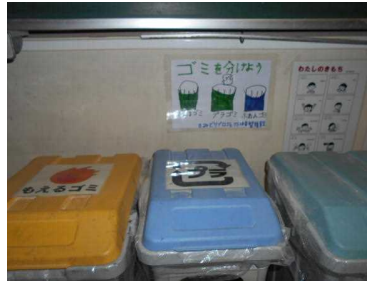
各担任による分別状況の 点検と児童への指導