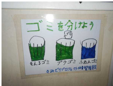
「ごみの分別」ポスター の作成(体育整美委員会)