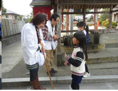
3年生 三番札所でお接待