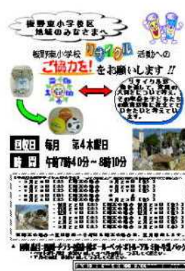
新聞折り込みで地域へ配布

月1回のリサイクルゴミの収集日を知らせる案内を地元新聞販売店の協力で新聞に折り込み配布していただいている。その結果、リサイクルの古紙やペットボトル等がかなり集められるようになった。また、子どもたちも給食後にミルクの紙パックを開いて洗うことが習慣化しており、ゴミ減量の意識づけになっている。