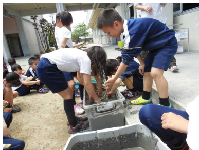
3年生 レンコン植え付け