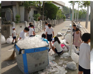
ペットボトルをリサイクル