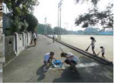
校門前(遍路道)清掃

学校の東隣に三番札所金泉寺があり、学校の前をお遍路さんが通る。県外や外国の方も少なくない。お遍路さんに気持ちよく通ってもらえるようにしている。