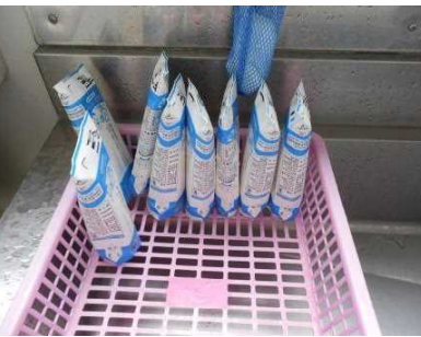
給食の牛乳パックも

毎月1回のリサイクルの日には、地域からも沢山の古紙や空き缶，ペットボトルなどが寄せられた。給食の牛乳パックもきれいに洗ってリサイクルしている。