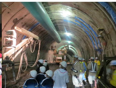
分校 大坂トンネル工事見学

他にも、低学年では木の葉や実を採集した作品作りや高学年では理科と関連した活動が見られた。