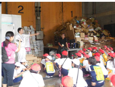
4年生 町環境センター見学