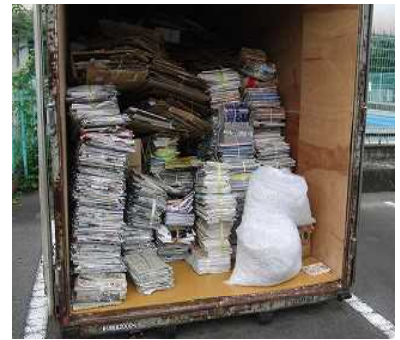
古紙回収 家庭や地域に呼びかけ、古紙の回収をしています