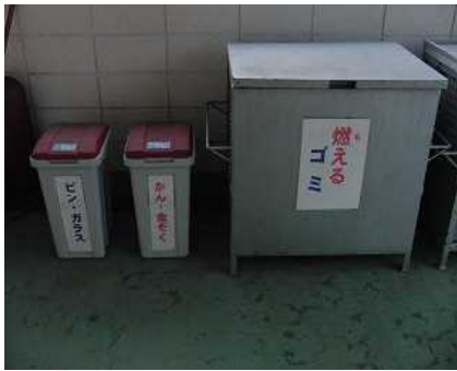
分別コーナー 燃えるゴミ、缶、びん等に分別し収集しています