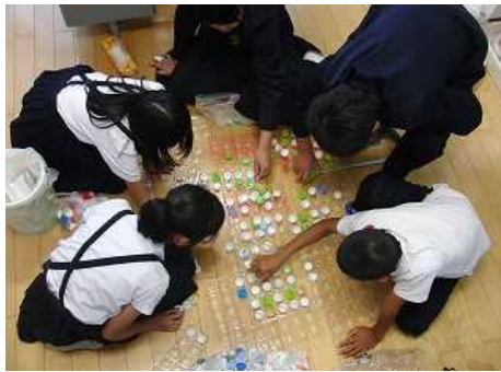
ペットボトルキャップ 保健委員会が回収・計測を行い、ワクチンと交換しています