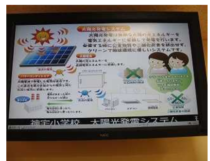
太陽光発電 太陽光発電について掲示しています