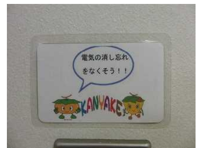
環境 I S O コーナー 活動写真・電気や水の使用量の グラフ等を掲示しています