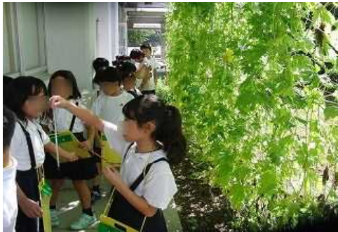
ゴーヤのカーテン 町役場と栽培委員会が連携しゴーヤを育てています 日なたと日陰の気温の違いを体感し、感想を環境ISOコーナーに掲示しています