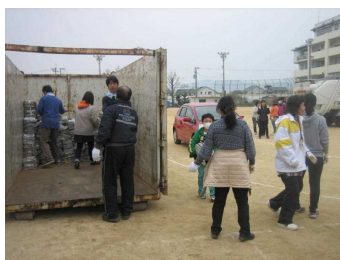
定期的に行われる町内一斉 「資源ごみリサイクルキャンペーン」