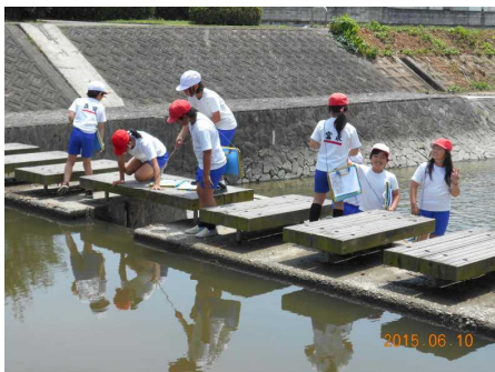
水をくみ上げ、透明度やにおいの検査も しました