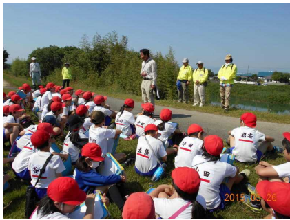
「正法寺川を考える会」の方々と 年間4回のフィールドワーク