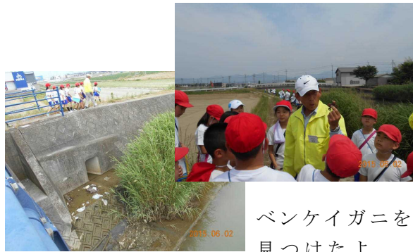
ベンケイガニを 見つけたよ 下流に集まったごみにびっくり