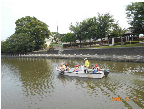
「カワセミ号」に乗って、野鳥や魚も観察