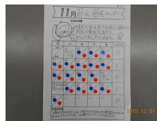
節電・節水・ごみ減量カレンダー