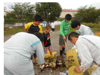
毎月第3日曜日に行われる 「正法寺川清掃活動」