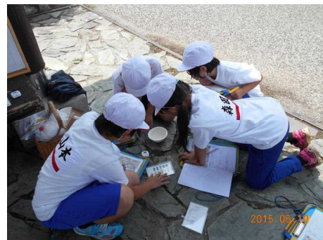
水質検査（5箇所と比較）