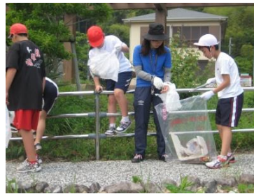
5月30日の「ごみ0活動」保護者や地域の方と一緒に町内の清掃活動に取り組みました