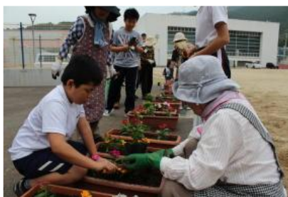
春と秋の2回，町婦人会の方と一緒にプランタの花の植え替えをし，花いっぱいの学校づくりに取り組んでいます