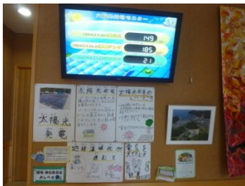
職員室前の廊下にある太陽光発電のモニターの下に，太陽光発電の紹介をすると同時に，環境問題についてのポスターを貼り，節電を呼びかけています