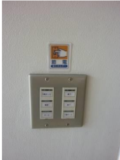
節電シールや節水ポスターを貼って節電，節水の呼びかけをしています