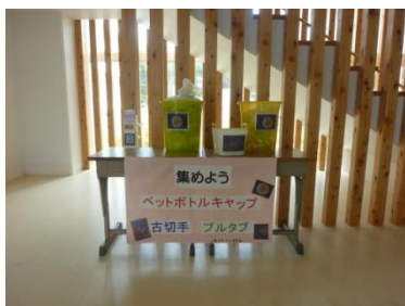
ペットボトルキャップ・プルタブを回収し、社会福祉に役立っています