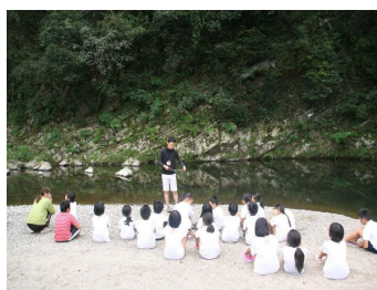
川の汚染や生き物調査 4年