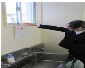
アートクラブによる節水と呼びかける掲示