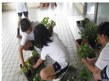
花苗植え 栽培・ボランティア委員会