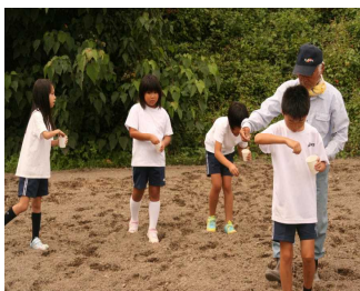
コスモスの種まき 3年