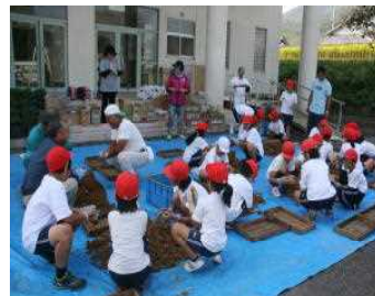
E M団子作り 4年