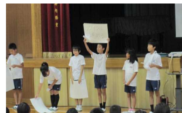
委員会による環境クイズ集会