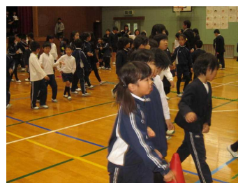
環境クイズ集会 栽培・ボランティア委員会