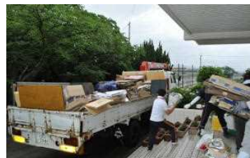
P T Aによる資源回収