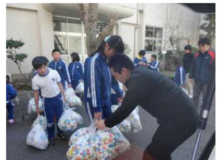
社会福祉協議会の方へペットボトルキャップを贈呈しています