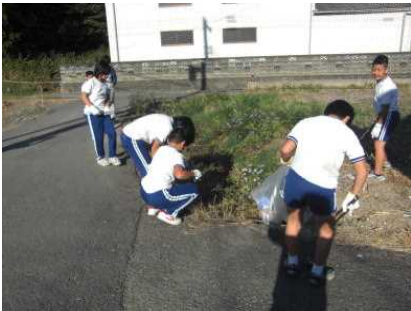
通学路を清掃しています