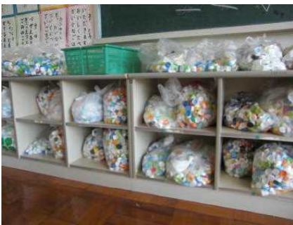
ペットボトルキャップ800個で一人分のワクチンになります