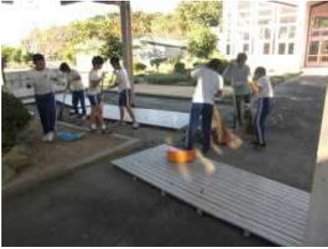
愛校活動を行っています