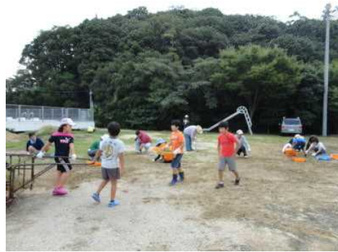
P T A 奉仕作業(保護者と共に)に参加しています